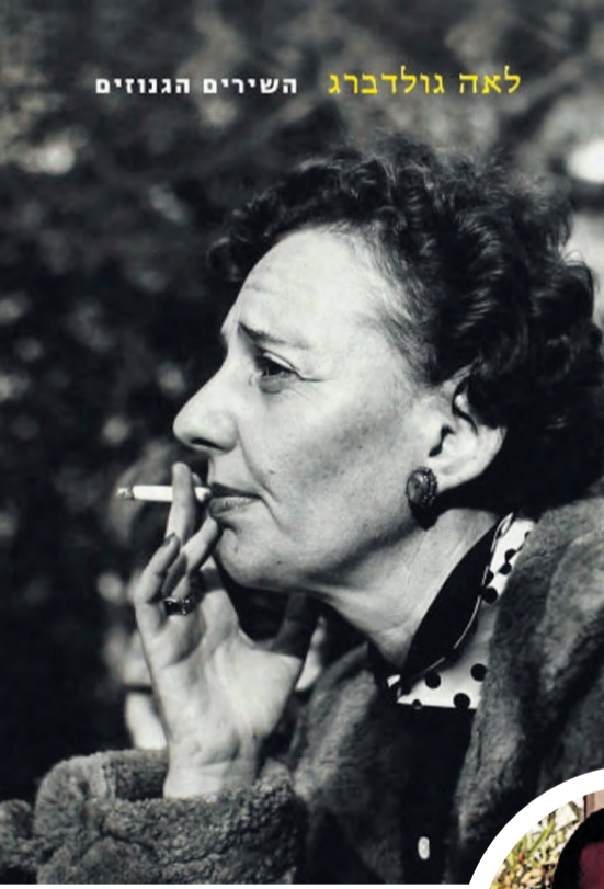
לאה גולדברג, השירים הגנוזים

"גולדברג היא במונח מסוים אחד מהקונצנזוסים האחרונים שנשארו לנו כחברה כי היא מוכירה לנו את העבריות: לא ישראליות, לא יהדות, אלא עבריות. העבריות, כפי שהיא מנסחת אותה בכתיבתה, היא פרויקט חדשני עם שאיפות גדולות אבל שפוי ומפוכח, שיש בו המון אופטימיות ובו בזמן הוא מודע לשכר: תחילה לשכר של המודרניזם ובהמשך לשכר של מלחמות העולם. גם אצל גולדברג רואים כל הזמן את השבר הזה. שירתה חותרת לשפיות ומקדשת את חיי היומיום, את החולין. היא לא רוצה לכתוב על ההיסטוריה ועל התמורות הגדולות אלא על האדם שהיא רואה בשעת האירועים האלה. נדמה לי שכולנו מתגעגעים לגישה הזאת, שרואה בחולין, בשגרה האפורה והקשה של כולנו, איזה ניצחון מתמיד. ובתוך החולין יש רגעי חסד, כפי שהיא כותבת באחד משיריה ליל-דים, שמתוך שלולית חומה נשקפים השמיים".