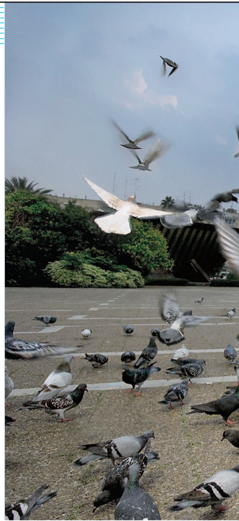
נתן זך

אחרי ניסיונות של שנים לברוח מהעולם של אלתרמן, חזר נתן זך להיות חלק מאותו הנוף שאליו הפנה עורף בעבר. לבסוף הבין שיש לכל זה טעם, שגם הוא עץ השדה